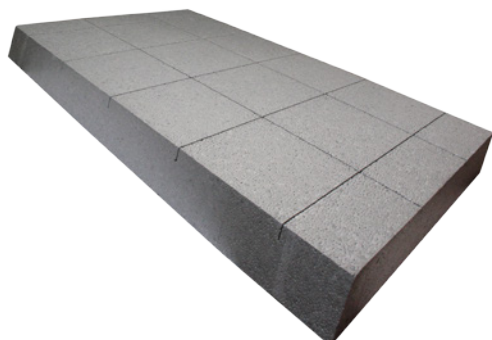
FACCIA ESTERNA DETENSIONATA

La lastra di colore grigio argento presenta dei tagli detensionanti incrociati sulla faccia esterna dove verrà eseguita la rasatura armata uniformante. La presenza di questi tagli migliora la stabilità dimensionale della lastra e riduce le tensioni indotte dai cicli termici. La lastra in EPS SILVERTECH 031 grazie ad una goffratura superficiale a disegno regolare sulla faccia interna, rende intuitiva la modalità di incollaggio e aumenta la superficie utile per l'adesione del collante.